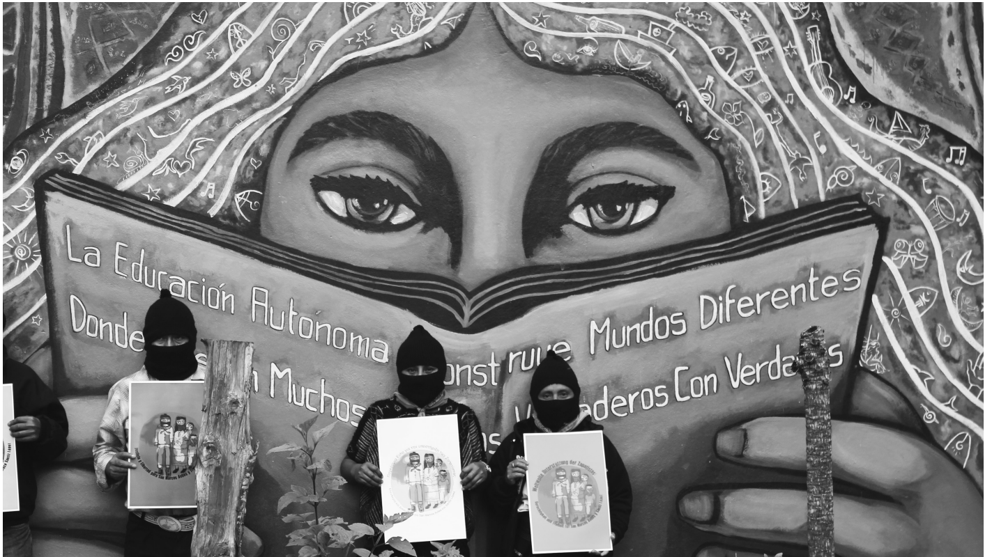
Zaptist@s vor einem Wandgemälde in Oventic, Chiapas/Mexiko

Diese Strategie wollen wir hier im Folgenden als Grundlage nehmen, um uns mit einer revolutionären Perspektive zu befassen.