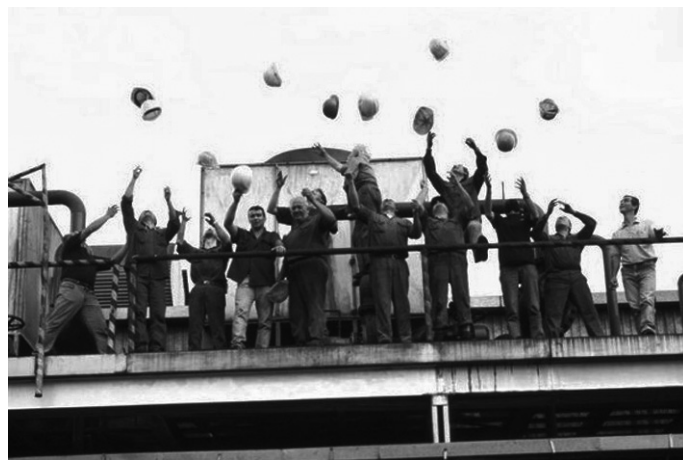
Arbeiter*innen in einem selbstverwalteten Betrieb in Argentinien

Berxwedan Jiyane – Leben heißt Widerstand.