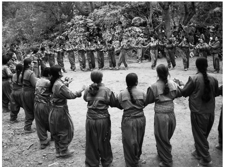
Tanzende Kämpferinnen der PKK (Arbeiterpartei Kurdistans)

Dieses Verharren in den eigenen kleinen Strukturen und das fehlende Einbringen in aktuelle Kämpfe führt dazu, dass die meisten linken Gruppen in Münster, sowie ihre Positionen und Inhalte in der breiten Öffentlichkeit unsichtbar bleiben. Die Formen, die gewählt werden, um eine Außenwirkung zu erzielen, sind zur Zeit oft erfolglos. Statt eines breiten Diskurses darüber, wie und mit welchem Ziel wir eigentlich Politik machen und Inhalte in die Gesellschaft tragen, wird in der Regel unhinterfragt an alten Handlungsmustern festgehalten. Bei Aktionsformen fehlt es oft an der Frage, was oder wer damit erreicht werden soll. Viele Demonstrationen und andere Aktionen, wie sie zur Zeit durchgeführt werden, interessieren über ihre Dauer hinweg kaum jemanden mehr, da wir nicht in der Lage sind, praktisch eine Alternative zu dem Kritisierten anzubieten.