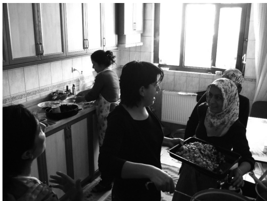
Arbeiterinnen in einer selbstorganisierten kurdischen Frauenkooperative in Diyarbakır/Türkei

Bei der Gründung von Kollektiven ist es jedoch wichtig, dass eine enge Vernetzung und Kooperation stattfindet. Das Lower Class Magazin spricht hier vom Einrichten von Institutionen. Solche Räte/Institutionen sind eine Instanz, in denen sich die jeweiligen Projekte organisieren, um gemeinsam zu diskutieren und Entscheidungen zu treffen. Es ergibt sich so die Möglichkeit der bedarfsorientierten Koordination sowie der gegenseitigen Unterstützung der verschiedenen Initiativen: Sollte z.B für ein Kollektiv, welches Aufstriche herstellt, eine Kinderbetreuung für die Kinder der Arbeitenden notwendig sein, so gibt es dort die Möglichkeit, diese Betreuung gemeinsam zu organisieren. Für den Fall, dass es in einem Kollektiv einen Konflikt zwischen Personen (oder auch Konflikte zwischen Kollektiven) gibt, bei dem eine Vermittlung benötigt wird, kann ein Rat diese einrichten. Es kann geschaut werden, wo es noch Bedarf nach einem Fahrradladen oder einem Stadtteilzentrum oder einer Kita gibt und bei der Realisierung dieser unterstützt werden. Auch bei ökonomischen Problemen kann ein gemeinsamer Umgang damit geschaffen werden.