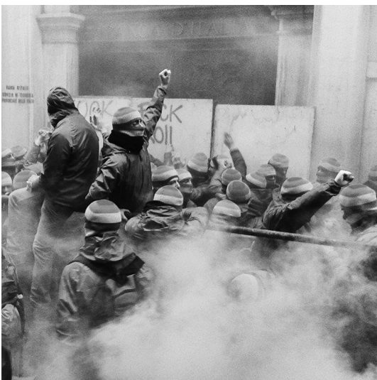
Antikapitalistische Aktivist*innen im März 2015 in Venedig/Italien

Unserer Meinung nach ist ein Diskurs über Perspektiven linksradikaler Politik in Münster längst überfällig. Diese Notwendigkeit resultiert aus dem derzeitigen Zustand der (radikalen) Linken in Münster, den wir hier vorsichtig als desorientiert, marginalisiert und zersplittert bezeichnen würden - was wir aber im Folgenden noch weiter ausführen werden. Dieser bedauerliche Zustand ist seit Jahren weitestgehend unverändert, ohne dass breitere Auseinandersetzungen hierüber stattfinden. Ein Ausweg kann nur mit einer Kritik der bisherigen Situation beginnen, um dann gemeinsam eine zukunftsfähige Perspektive zu entwickeln.