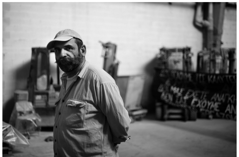
„(...) Wir sagen, die Arbeiter*innen sollten die Fabriken übernehmen und selbstständig betreiben (...)“ ein Arbeiter der besetzten Seifenfabrik „Vio.Me“ in Griechenland

Dies ist die einzige Möglichkeit, auch unseren eigenen Alltag als Teil eines politischen Kampfes zu verstehen und diesen mitsamt allen Schwierigkeiten, seien sie nun ökonomischer oder emotionaler Art, gemeinsam zu tragen – und nicht mehr nur einer Hobbypolitik nachzugehen.