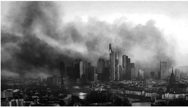
Rauchschwaden am Vormittag des 18 März 2015 bei den Krawallen während der Blockupy Proteste in Frankfurt am Main/Deutschland

nisse mit einer fundierten Alternative in der Hinterhand kritisiert werden. Eine ernsthafte Gesellschaftskritik muss dringend wieder auf die Agenda der Linken in Münster gesetzt werden. Hierbei reicht es nicht, die Kritik für sich selbst zu formulieren, sondern es müssen Mittel und Wege gefunden werden, diese in die breite Öffentlichkeit sowie in bestehende Kämpfe zu transportieren.