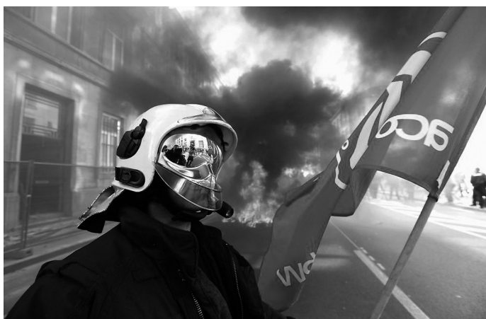
Streikender Feuerwehrmensch im Oktober 2013 in Brüssel/Belgien

Darüber hinaus fehlt es meistens an der Beachtung der verschiedenen gesellschaftlichen Lebensrealitäten. Wenn Kämpfe revolutionär sein wollen, müssen sie lebensstrukturierende Bereiche betreffen, da sie ansonsten an unserem Alltag vorbeiführen. Somit ist es - wenn man unsere aktuellen Kämpfe betrachtet - auch kein Wunder, dass sich keine großen Massen für das interessieren, was wir tun und zu sagen haben.