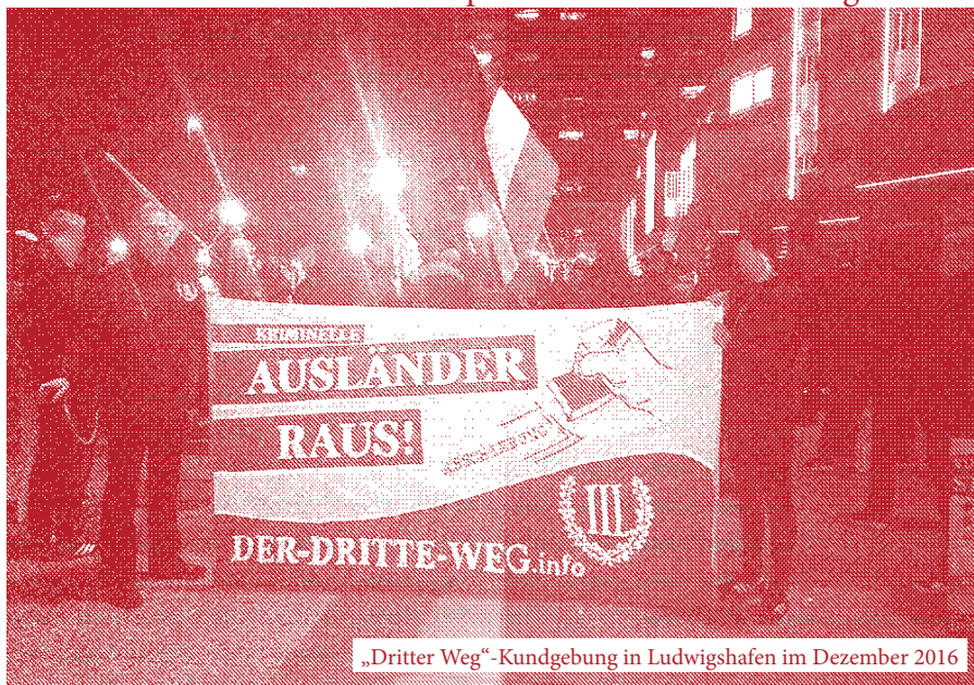
„Dritter Weg“-Kundgebung in Ludwigshafen im Dezember 2016

In seiner strategischen Aufbauphase ist das Projekt „Der Dritte Weg“ noch keine führende und bundesweit etablierte faschistische Kraft. Zwischen ihrem militanten Schein und ihrem tatsächlichen Sein liegen noch große Unterschiede. Jedoch kann „Der Dritte Weg“ durch die Schwäche und Fehler der linken und antifaschistischen Bewegung und der Unfähigkeit anderer konkurrierender faschistischer Projekte, wie der Partei „Die Rechte“ oder der „NPD“, auf fruchtbarem Boden agitieren. Ihr militantes Auftreten, ihre Erfahrung aus verschiedenen faschistischen Organisationsanläufen und die Nähe und personelle Überschneidung zum fa-